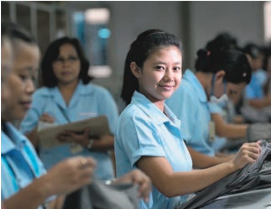
Arbeiders aan het werk in een kledingfabriek in Indonesië